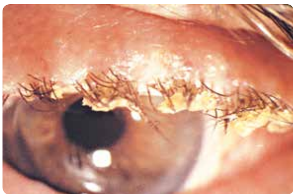
Symptomer på blefaritis.